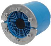
RS yalıtım malzemesi